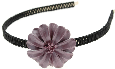
Knyttet hårbøjle med læderblomst